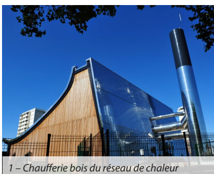
1 – Chaufferie bois du réseau de chaleur

D'ambitieuses modalités de concertation autour du Plan Climat Air Énergie Territorial (PCAET) ont été mises en place de juillet à octobre 2019. La plateforme numérique a recueilli plus de 1 000 contributions et 4 000 votes exprimés par 350 participants, et les 3 réunions publiques ont réuni une centaine d'habitants. L'ouverture des données en Open Data sur le portail de Grand Poitiers a facilité la participation. 82 % des contributions ont été intégrées à la version finale du PCAET.