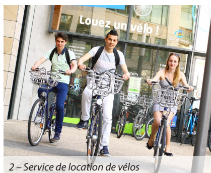
2 – Service de location de vélos