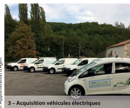
3 - Acquisition véhicules électriques