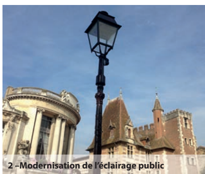
2 - Modernisation de l'éclairage public