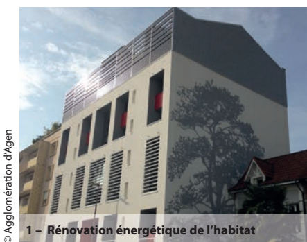
1 - Rénovation énergétique de l'habitat

L'Agglomération a signé une convention de partenariat avec la chambre d'agriculture pour notamment le développement de l'approvisionnement des cantines en produits locaux, et la recherche de sites naturels pour la mise en place de mesures de compensations écologiques suite à la construction d'infrastructures routières. La collectivité financera un document de vulgarisation des résultats d'une étude sur l'adaptation des grandes cultures au changement climatique.