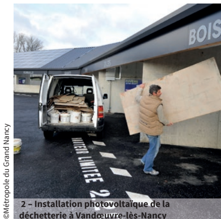
2 - Installation photovoltaïque de la déchetterie à Vandœuvre-lès-Nancy