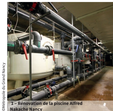
1 - Rénovation de la piscine Alfred Nakache Nancy

En 2016, lancement d'un second marché pour l'achat de gaz, mais cette fois sur toute la Lorraine.