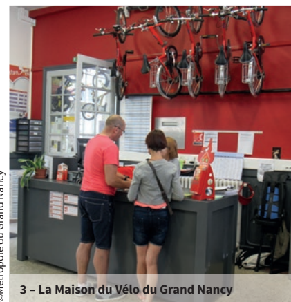
3 - La Maison du Vélo du Grand Nancy