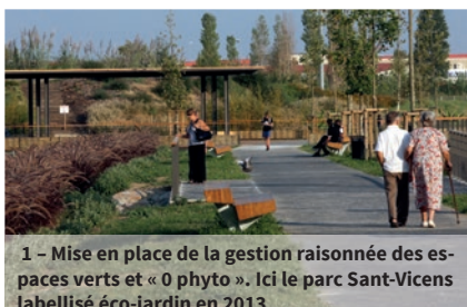
1 - Mise en place de la gestion raisonnée des espaces verts et « 0 phyto ». Ici le parc Sant-Vicens labellisé éco-jardin en 2013