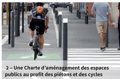
2 - Une Charte d'aménagement des espaces publics au profit des piétons et des cycles