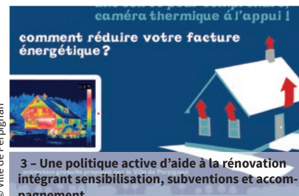
3 - Une politique active d'aide à la rénovation intégrant sensibilisation, subventions et accompagnement