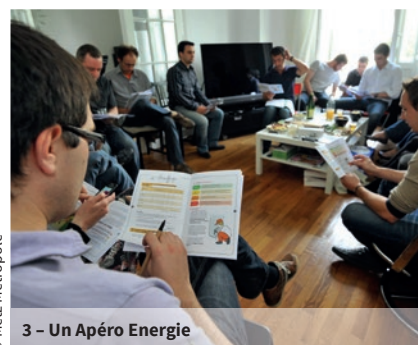
3 - Un Apéro Énergie