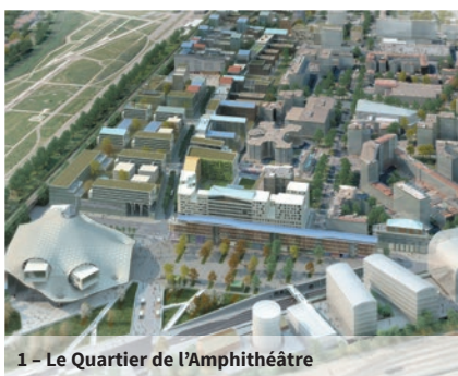
1 - Le Quartier de l'Amphithéâtre

De ClimatCités et de la création de l'ALEC en 2011, ont découlé des actions devenues pérennes, destinées aux citoyens (Apéros Énergie, Balades Thermographiques...) ou aux communes membres (Conseil en Énergie Partagé...).