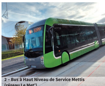
2 - Bus à Haut Niveau de Service Mettis (réseau Le Met')