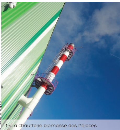
1 - La chaufferie biomasse des Péjoces

Le concours Famille Eco-Logis, qui traite de l'énergie, de l'eau et des déchets, a été étendu à toutes les communes.