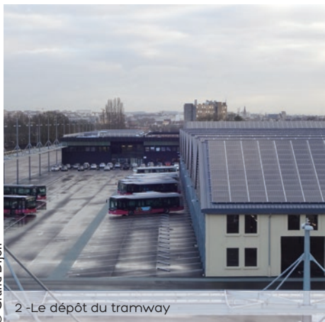
2 - Le dépôt du tramway